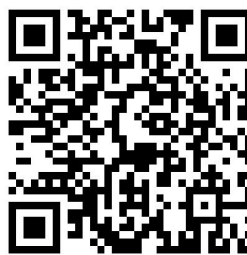
应急权力事项清单