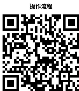
1、烟花爆竹经营（零售）许可

http://zwfw.fuxin.gov.cn/epoint-web-zwdt/epointzwmhwz/pages/legal/personaleventdetail?taskguid=19c2a223-db30-44d6-8a97-8f0b924e169a